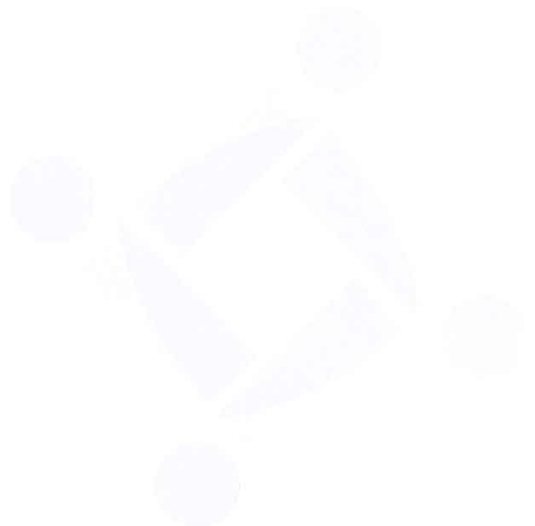
MTRA. BEATRIZ EUGENIA RODRÍGUEZ VILLANUEVA CONSEJERA ELECTORAL

En tal sentido solicito se adjunte como engrose del acuerdo indicado al rubro el presente VOTO CONCURRENTE , presentado en tiempo y forma, de conformidad con lo establecido en el artículo 38 fracción II del Reglamento de Sesiones del Instituto Electoral Coahuila.